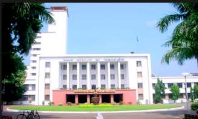
Indian Institute of Technology, Kharagpur, Ministry of Human Resource Development, India.