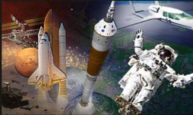
Indian Space Research Organisation Ministry of Science & Technology, India.