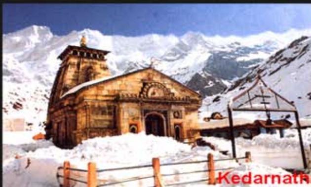
Kedarnath Dham existing since the time of Mahabharat is the holiest Hindu shrine (Altitude 3584M).